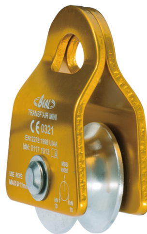
TRANSF'AIR MINI 迷你滑轮