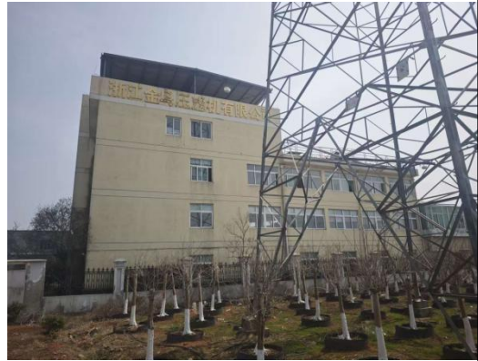
浙江金鸟压滤机有限公司办公楼