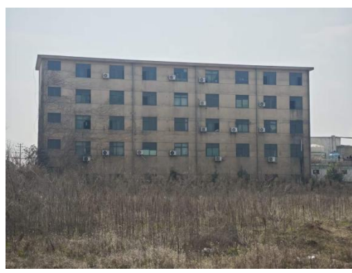
浙江大侠铝业有限公司宿舍楼