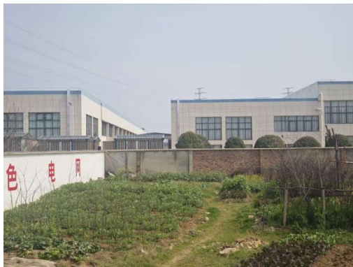
浙江丰帆数控机械有限公司厂房