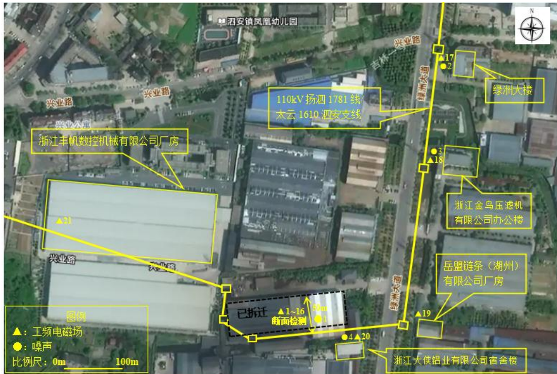
图 7-1 110kV 扬泗 1781 线 25#-27#/太云 1610 泗安支线 39#-41#迁改工程监测点 位示意图