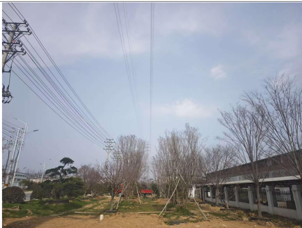
图 6-4 110kV 扬泗 1781 线 25#-27#/太云 1610 泗安支线 39#-41#迁改工程架空线路周边环境绿化恢复情况