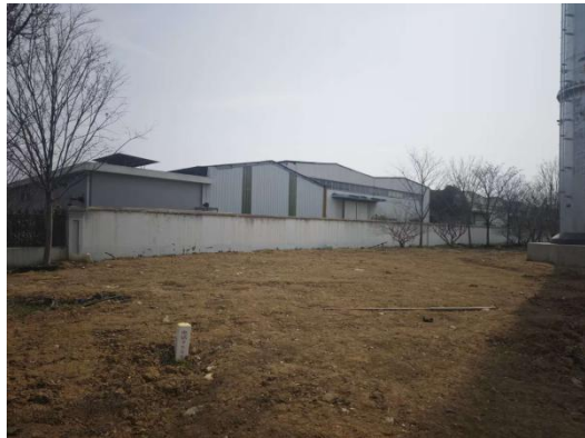
岳盟链条(湖州)有限公司厂房