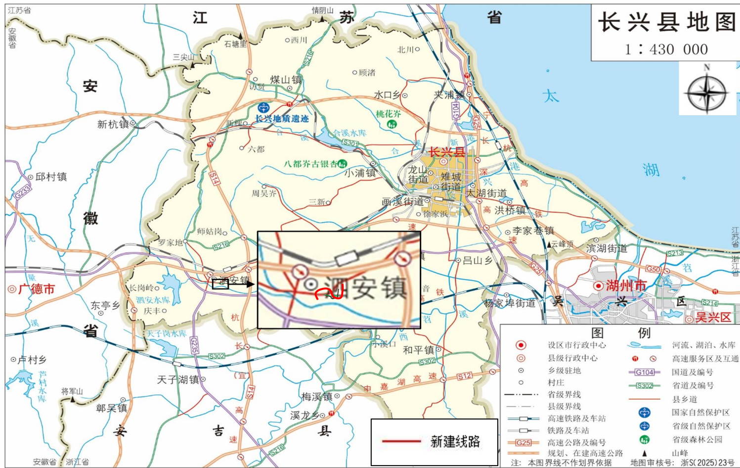
图 4-1 本项目地理位置示意图