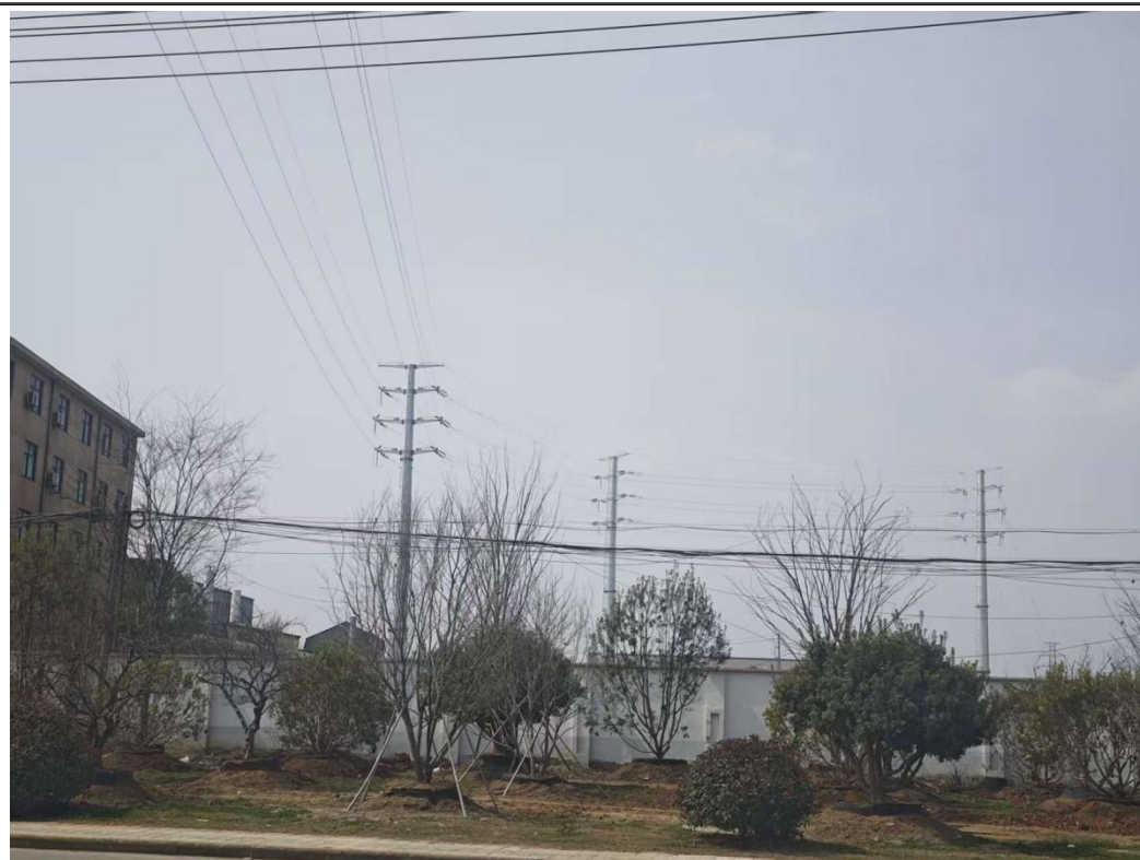
图 6-3 110kV 扬泗 1781 线 25#-27#/太云 1610 泗安支线 39#-41#迁改工程架空线路周边环境绿化恢复情况