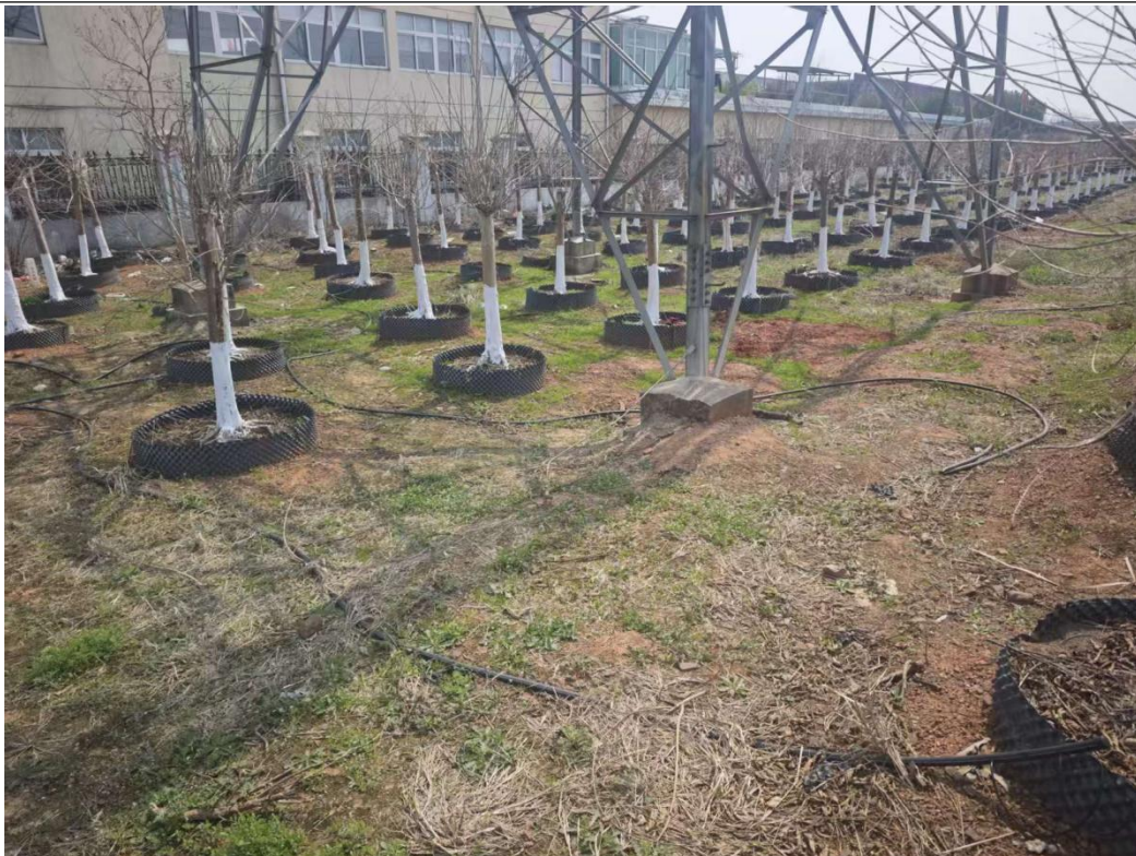
图 6-2 110kV 扬泗 1781 线 25#-27#/太云 1610 泗安支线 39#-41#迁改工程塔基周边环境绿化恢复情况