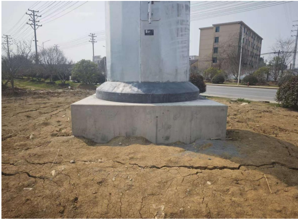
图 6-1 110kV 扬泗 1781 线 25#-27#/太云 1610 泗安支线 39#-41#迁改工程塔基周边环境绿化恢复情况